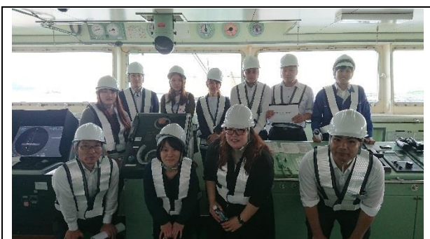
今回の研修参加者。各グループ会社より計8名が参加。